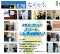
地域振興局スタート