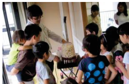
寄附金を活用して様々な活動を支援(信州子ども食堂の応援団募集など)