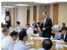
県と市町村との協議の場