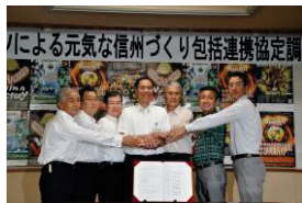
プロスポーツチームとの協定締結式