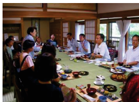
しあわせ信州移動知事室 ランチミーティング