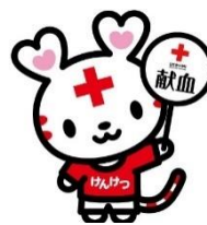
日本赤十字社公式キャラクター ハートラちゃん