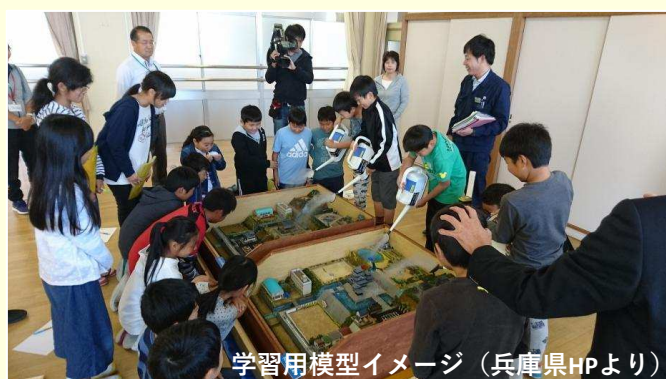
学習用模型イメージ