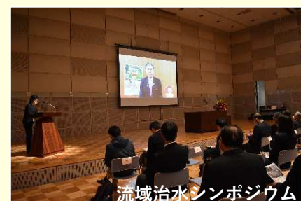
流域治水シンポジウム