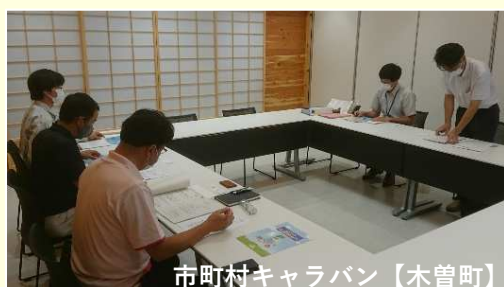
市町村キャラバン【木曾町】