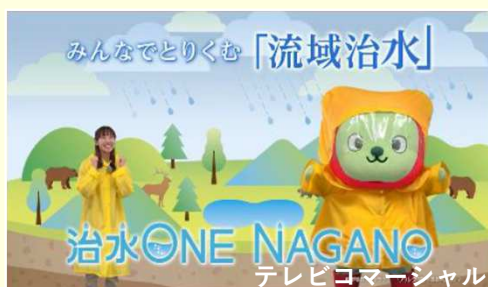
テレビコマーシャル