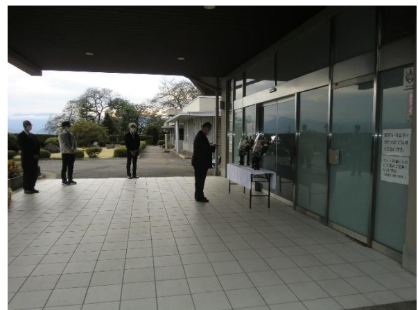
令和4年度に開催した動物慰霊の会の様子