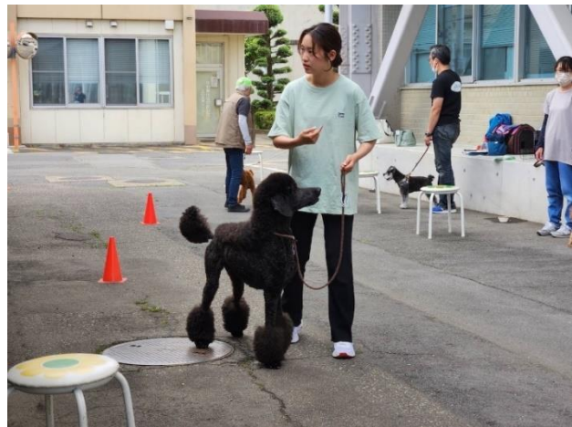
犬好き・しつけの勉強がしたい方はぜひインストラクターとして一緒に活動しましょう！

ボランティア活動がしたい方・もっと犬のしつけを勉強したい方など、ご協力いただける方はぜひ上田保健所食品・生活衛生課にお問い合わせください。