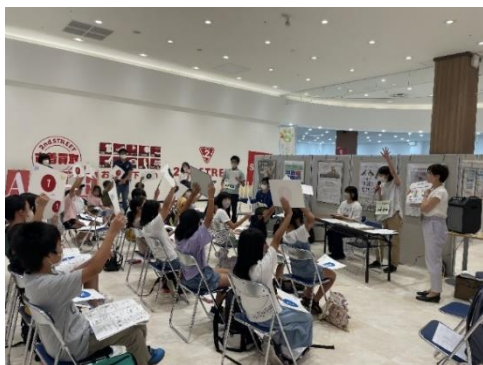
← 犬猫の飼い方クイズの様子

令和5年8月8日（火）に総合福祉センター及びイオンスタイル上田内で、「サマーチャレンジボランティア」（略して「サマチャレ」）が開催されました。サマチャレは、小学生以上のお子さんを対象に、福祉やボランティアに関心を持ってもらおうと、東御市社会福祉協議会が開いているイベントです。今年は、動物と人とのつながりやそれを支える獣医師・愛護団体・市役所などの仕事を学びました。全国的に取り組みが広がっている「地域猫活動」や、貧困や孤立など様々な社会問題と絡み合う「多頭飼育崩壊」など、実際に東御市で起きた実例を基にした話を、子供たちは真剣な表情で聞いていました。ペットを飼う責任や、動物を守る仕事の大切さを、改めて知る機会になったようです。