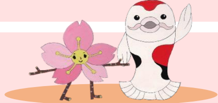
キルシェ カルプ 東信教育事務所キャラクター