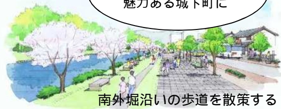
南外堀沿いの歩道を散策する