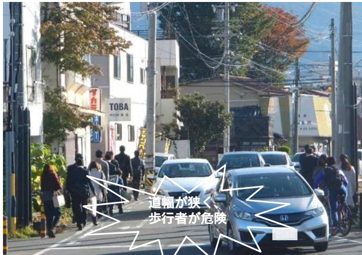
松本城交差点から西を臨む