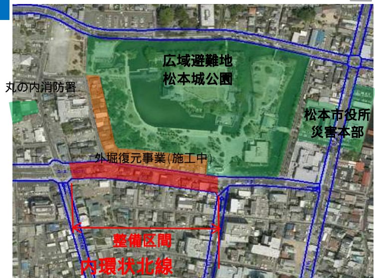
街路事業区間(施工中)