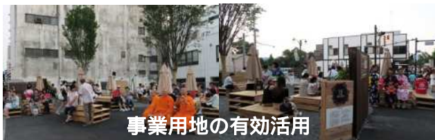
事業用地の有効活用