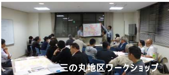
三の丸地区ワークショップ

住民参加により、事業区間を含めた【松本城三の丸地区】のまちづくりを検討しています。