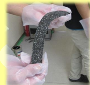
耐久性が高く、ねばり強いアスファルト舗装

12月13日(月)に長野須坂インター線(須坂市栃倉付近)にて「舗装工事現場見学会」を行いました。菅平より須坂に向かう車線の表層は県内初のアスファルト舗装材料を使用しています。その耐久性に期待したいです。