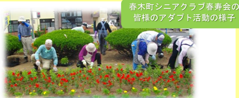
春木町シニアクラブ春寿会の皆様のアダプト活動の様子

サポーター :花苗、安全ベスト等活動に必要な物品の提供等の支援をしていただきます。特典:提供いただく物品に企業名を表示することができます。県のHPIに企業名を掲示し、県民の皆さんにPRします。