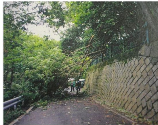
H26/8 台風時の倒木による交通障害 通報及び通行車両に対する対応をしてくださいました。