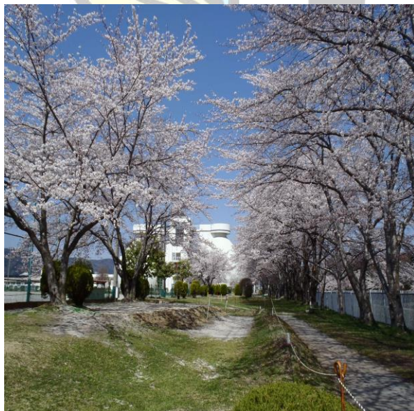
昨年春、処理場の融和施設（マレットゴルフ場）の桜。 卵形消化タンクがバックに見えます。