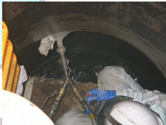
修繕工事（補修材注入作業）の様子