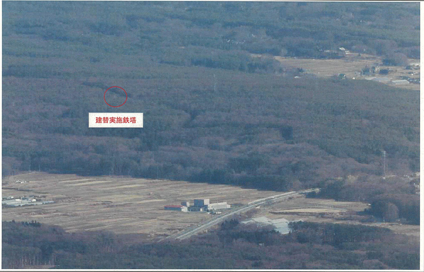
行為前の状況 入笠すずらん公園 八ヶ岳展望台からの眺望