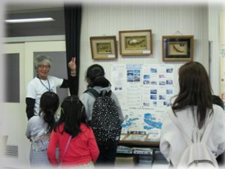
水産試験場諏訪支場