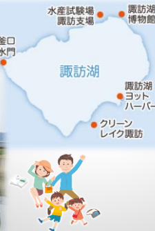
クリーンレイク諏訪