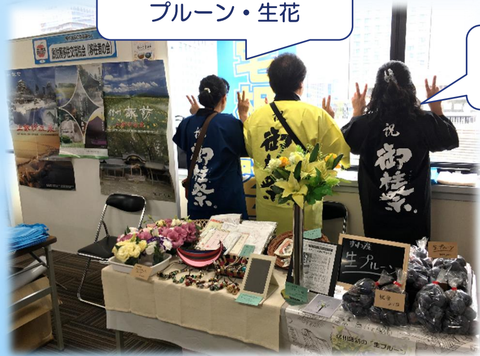
御柱の法被で 諏訪圏全体を PR