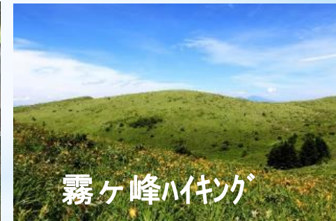
霧ヶ峰ハイキング