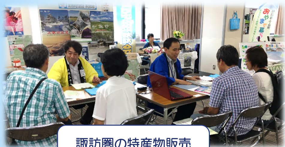
諏訪圏の特産物販売 プルーン・生花