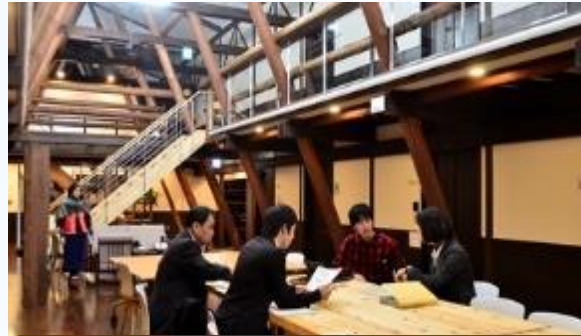
富士見 森のオフィス