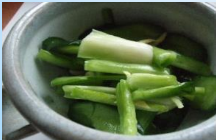
寒天・漬け物・伝統食