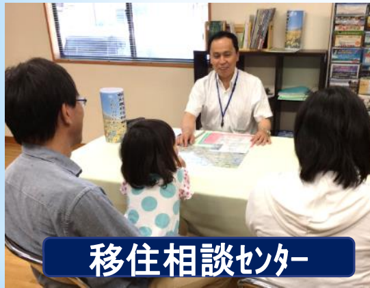
移住相談センター