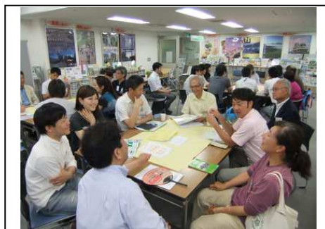
【諏訪圏合同移住セミナー&わいわく交流会】