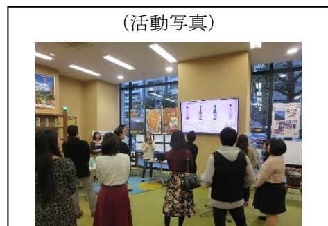
【3 移住促進型イベント @東京 移住・交流情報ガーデン】