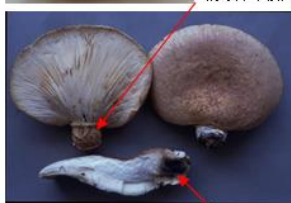
黒いシミがあるものが多い。黒いシミがほとんどないものもあるので注意が必要である。