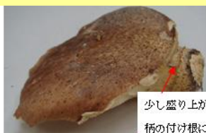
少し盛り上がったつばが柄の付け根にある