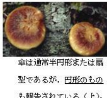
傘は通常半円形または扇型であるが、円形のものも報告されている(上)。

黒いシミがあるものが多い。黒いシミがほとんどないものもあるので注意が必要である。