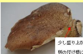
少し盛り上がったつばが柄の付け根にある