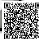
【動画】ノロウイルス等の食中毒予防のための適切な手洗い

https://www.youtube.com/watch?v=z7ifN95YvDM&feature=youtu.be