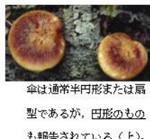
傘は通常半円形または扇型であるが、円形のものも報告されている(上)。

黒いシミがあるものが多い。黒いシミがほとんどないものもあるので注意が必要である。