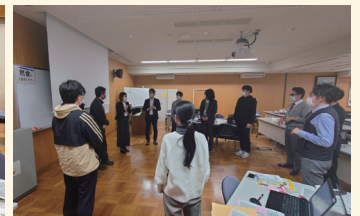
R4年度の「社会教育主事講習」の様子