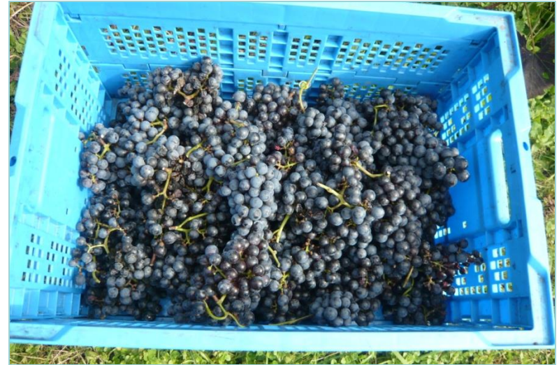
ワイン用ブドウの収穫風景