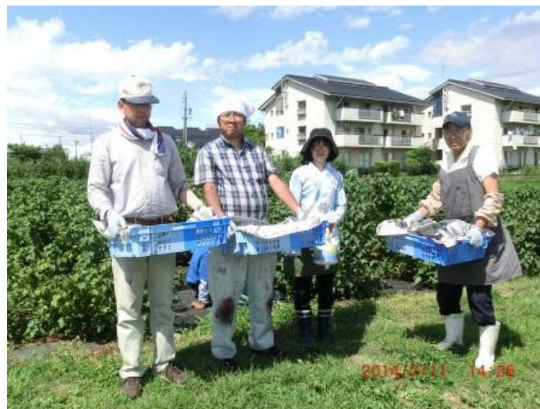
炎天下の作業でも頑張ってます！