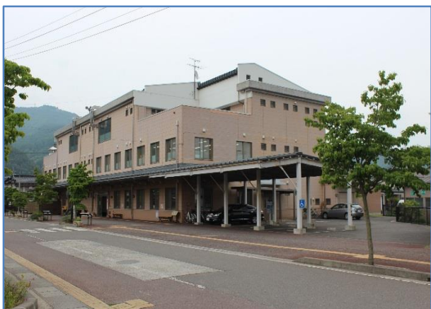
大町市総合福祉センター外観