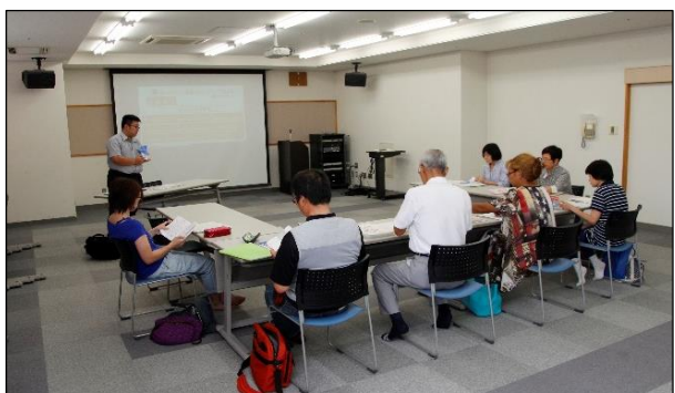
住民を対象とした「障がい理解促進講座」 （「あいサポーター研修」）の開催