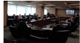
（生活経済対策有識者懇談会）

新型コロナウイルス感染症による県民生活や県内経済への影響について把握するとともに、その影響の最小化を図るため、幅広い分野の有識者や市町村関係者等から意見を聴取