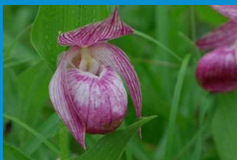
・企業と学校の初の協定