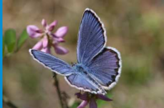
・制度初、第一号の協定