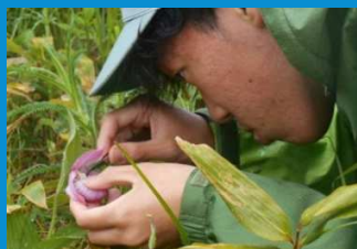
・野生個体の人工授粉作業