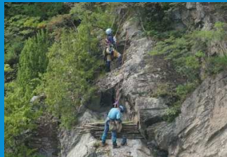
・クライマーによる崖面の作業