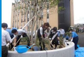
・同種保護区を本社に整備