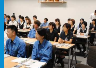
・社員への環境教育学習