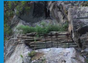
・人工的に復元された巣棚