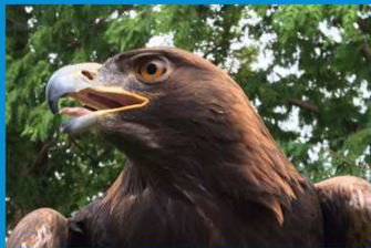
・県外企業の第一号協定