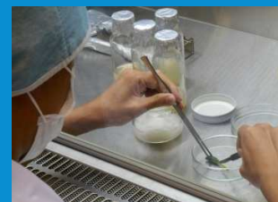
・種子から無菌培養で増殖