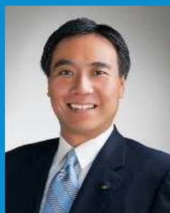
長野県知事 阿部 守一

長野県の自然環境は、「日本の屋根」と言われる3,000m級の高山や里地里山、湖沼など変化に富み、その「恵み」の下で多様な生物が育まれています。