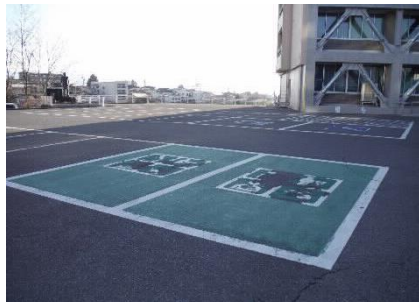
正面玄関側駐車場