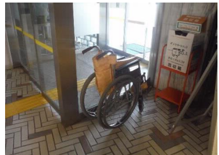
1階エントランスホール