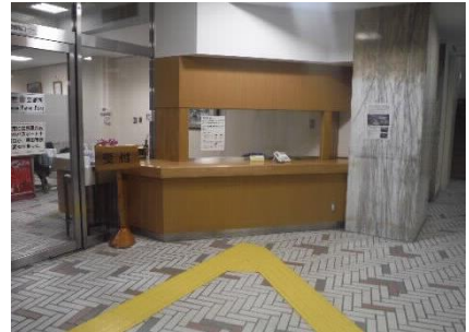
1階エントランスホール