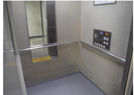
1階エントランスホール