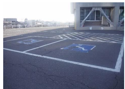
正面玄関側駐車場