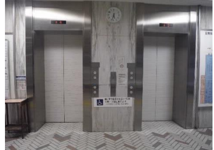
1階エントランスホール