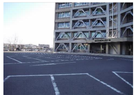
正面玄関側駐車場