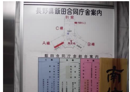
1階エントランスホール