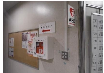
1階エントランスホール