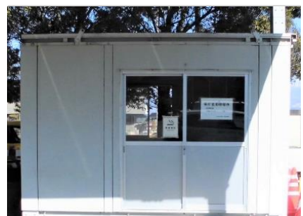
駐車場太陽光パネル下