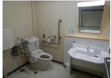
1階車いす対応トイレ