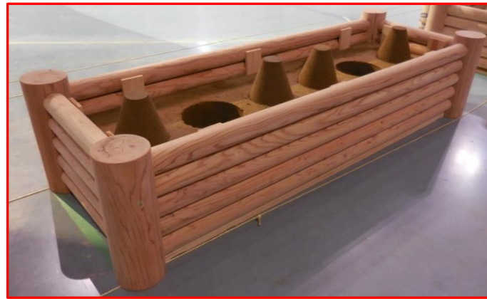
品名 植樹箱 樹種 スギ 材料納入 長野県森林組合連合会 一口メモ 農林中央金庫から資金協賛