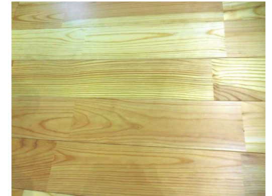
品名 床 樹種 アカマツ 委託先 征矢野建材株式会社