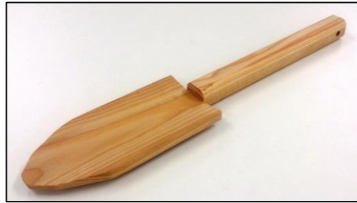
品名 移植ごて 樹種 カラマツ 材料納入 長野県木材協同組合連合会 一口メモ 代表者記念植樹時に使用