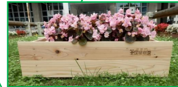
品名 プランターカバー 樹種 スギ 委託先 長野県木材協同組合連合会