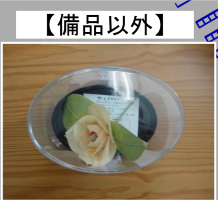
品名 賞状筒飾り 樹種 ヒノキ 製作 こまかさワークセンター 一口メモ ・木曽ひのき(人工林)を使用 ・感謝状贈呈者、表彰者へ渡される賞状筒に使用