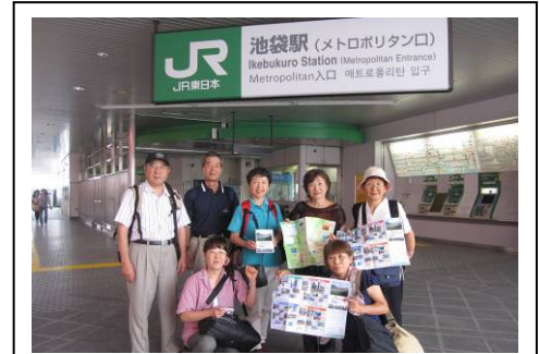
【 東京主要駅での広報活動 】