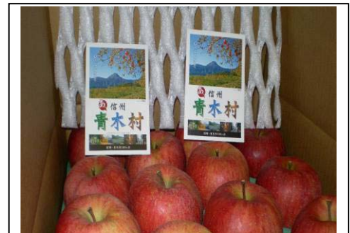
【 りんごの出荷箱に葉同梱 】