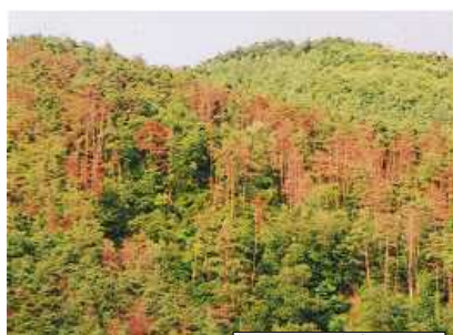
松くい虫被害の状況