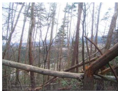
被害に遭った森林の状況