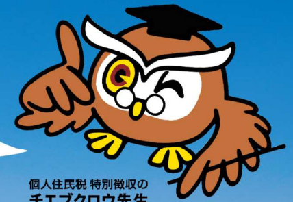
個人住民税 特別徴収のチエブクロウ先生

個人住民税の特別徴収は法律で義務付けられています。ここでは、特別徴収とeLTAXについてわかりやすく解説します！