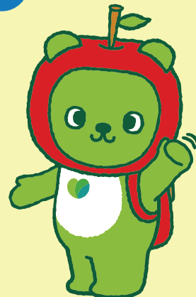
長野県PRキャラクター「アルクマ」