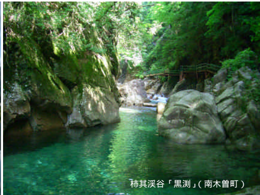
柿其溪谷「黒淵」(南木曾町)