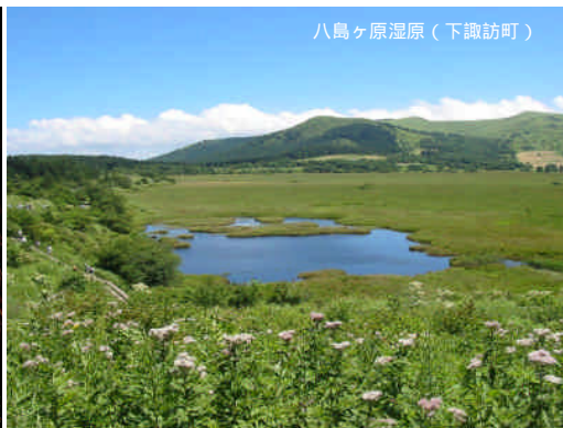
八島ヶ原湿原（下諏訪町）