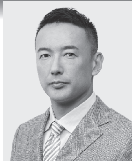
れいわ新選組 代表