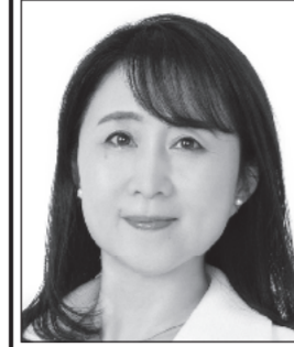
やた わか子 国民民主党 副代表 あなたと動けば、未来は変わる。