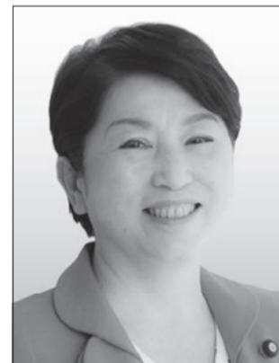
社民党党首 福島みずほ