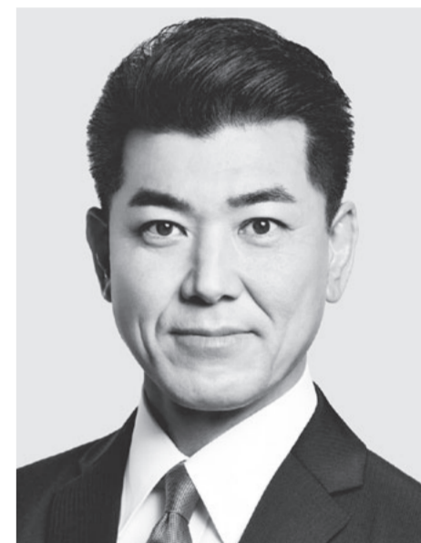
立憲民主党 代表 泉 健太