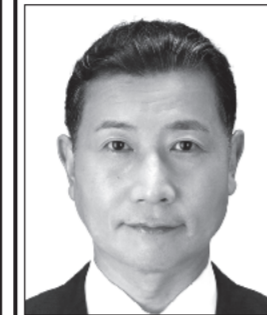
よしかず たるい 良和 元衆議院議員 表現の自由を守る・日本V字回復やったるい