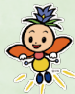
長野県選挙啓発 マスコットキャラクター ほたりちゃん

「ほたりちゃん」には、「明るく、きれいで正しい」選挙が行われるようにという願いが込められています。このキャラクターは、長野県のきれいな清流に棲み、明るく光る「ホタル」と長野県花であり、高原に咲き、花言葉である正義を象徴する「リンドウ」をモチーフとしています。