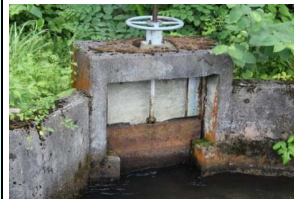
老朽化した取水ゲート、断面も不足している