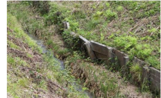
老朽化し、崩落し始めた幹線排水路、機能を維持するための更新が