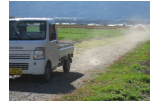
路面が未舗装のため農作物に粉塵被害が生じている