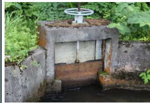
老朽化した取水ゲート、断面も不足している