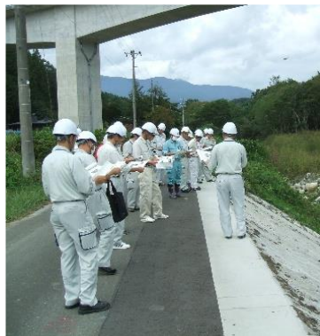
工事検査研修の様子