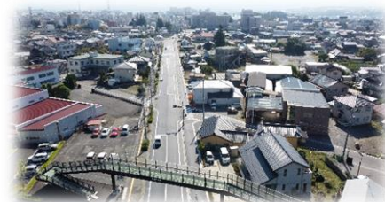
飯田中津川線（飯田市知久町）