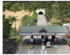
料金所（白馬長野有料道路）