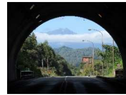
日高トンネルから白馬方面を臨む