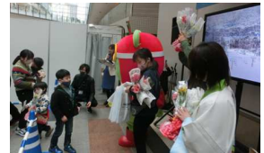
神戸空港での県産花きPR

・県内の小中学校35校（児童生徒4,525名）で花育教室を開催した。花育教室を受けた児童生徒の家庭に行ったアンケートでは、花育教室後、15.3%の家庭で花の購入回数が増加した。 ・長野駅及び松本駅改札口において、年間を通して旬の県産花きの展示、また、大阪駅、神戸空港において、花束を配布し、県産花きのPRを行った。