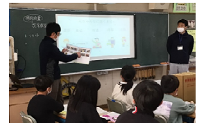
花育教室（講師：花き生産者）