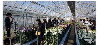
花き関係者と連携した研修会の開催