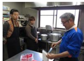
大学生のペンション仕事体験