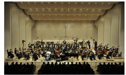
オーケストラ・コンサート