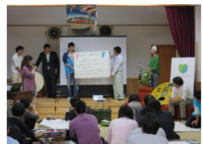
地域おこし協力隊交流会

地域おこし協力隊員数 H29年度:目標 90人 ⇒ H26年度:実績 135人 (H27年3月31日現在の隊員数) ※北海道に次ぎ、全国で2番目に多い隊員数