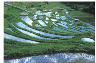
千代のよこね田んぼ (ふるさと信州風景百選)

応募件数 953件 冊子発行部数 無償版2,000部（県内小中学校、図書館等に配布） 有償版5,000部（当初3,000部、増刷2,000部）