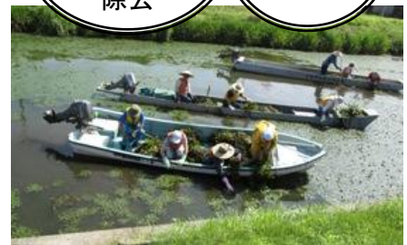
諏訪湖環境改善行動会議 によるヒシの除去