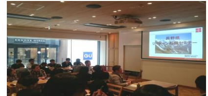
銀座NAGANOでの U・Iターン転職セミナー

○H26年9月から39市町村転入窓口で移住者アンケートを実施 ※H27年度からは全市町村で実施 相談件数 H26年度:目標 2,800件 ⇒ 実績 4,382件