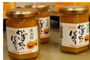
地元産品の産業化 (清内路かぼちゃを使用した かぼちゃバター)