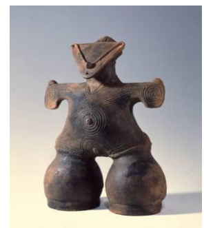
国宝土偶「仮面の女神」