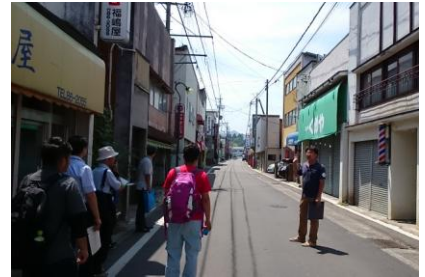
フィールドワーク

塾生による地域課題の解決に向けた事業の立案件数 H26年度:目標 3件以上 ⇒ 実績 8件