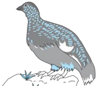
ながのけん 長野県の しょうちゆう 象徴である とり 鳥「らいちょう」

くだもの 果物では りんご りんごが ゆうめい 有名です。ぶどうや ぷるーん プルーン、あんず、 ぷるーべりー ブルーベリー せいさんりよう 生産量が おおい 多いです。野菜は やさい 野菜は れたす レタス、 せろり セロリ、 あすぱらがす アスパラガス、 わさび ワサビ せいさんりよう 生産量が とく 特に おおい 多いです。