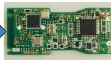
RF-ICを搭載したPico950の回路基板