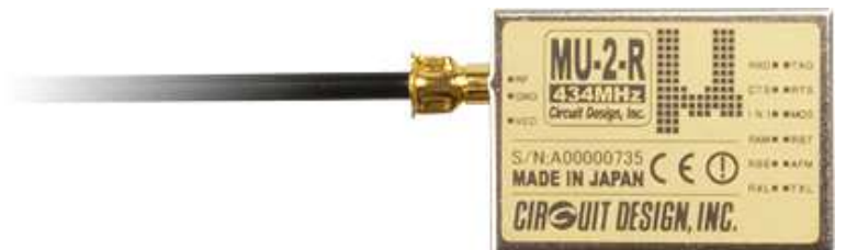
欧州の認証を取得した製品「特定小電力 シリアルデータ伝送無線モデムMU-2」