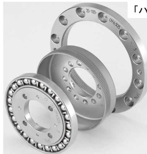
「ハーモニックドライブ® CSDシリーズ」

80年代初めのCSシリーズ(左)と現在主力のCSFシリーズ(中)では、厚さが3/5になり、次世代のCSDシリーズ(右)は、CSシリーズの1/3の厚さで、高トルク・高回転精度を引き出します。