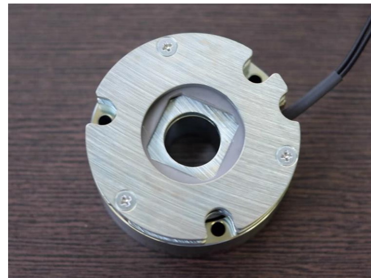
ドラグレスブレーキ