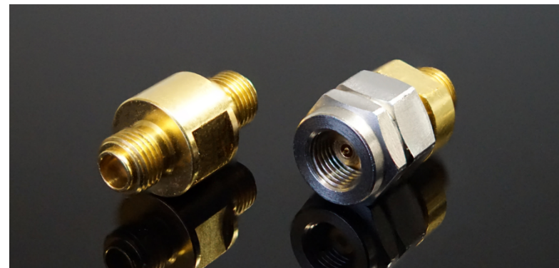
(次世代0.8mmコネクタ メス-メス(左)、オス-メス)