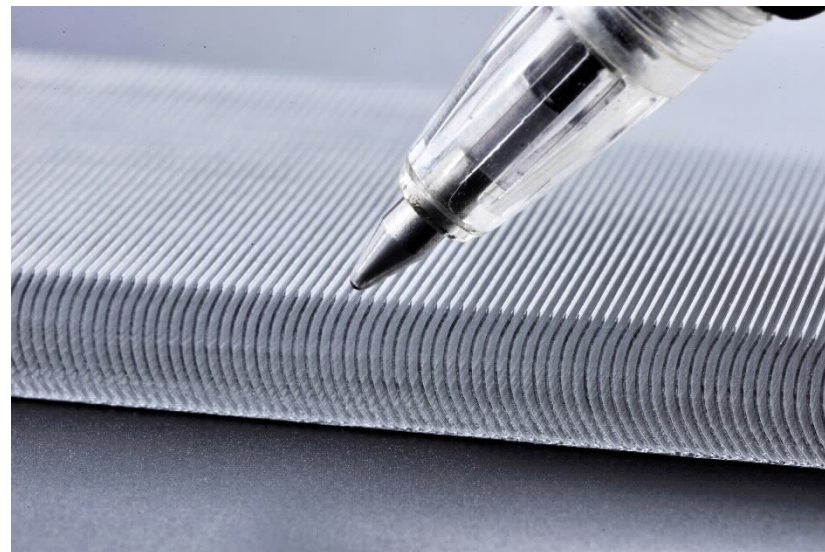
(0.35mmピッチのアルミの強制空冷マジックヒートシンク)