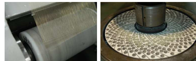
MPSのコアである遊離、固定砥粒加工技術