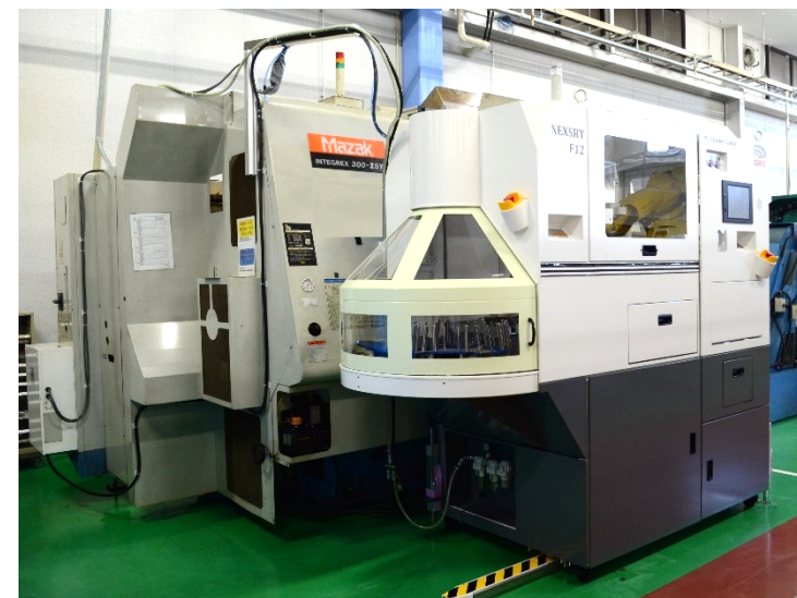
NEXSRT® F12 (複合旋盤接続時)

システム本体を横スライドすると、手動作業への切替が可能。連動位置戻し時にはレーザーセンサで自動位置補正を行う。