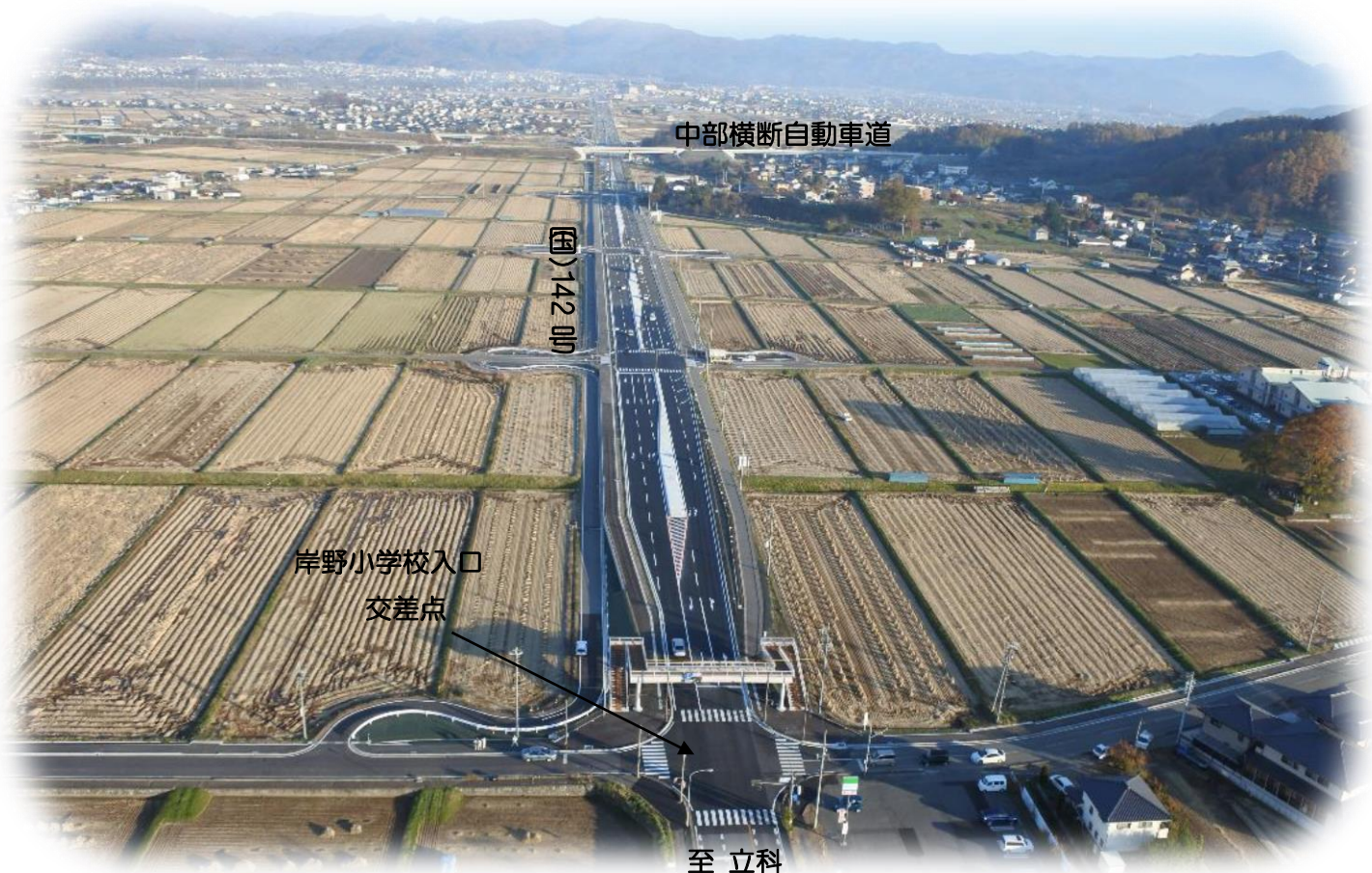
全景（岸野小学校入口交差点から跡部側を臨む）