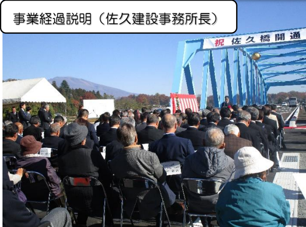
事業経過説明（佐久建設事務所長）