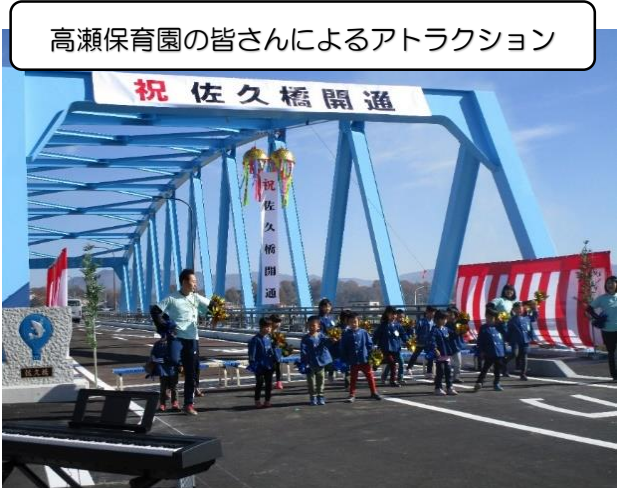
高瀬保育園の皆さんによるアトラクション