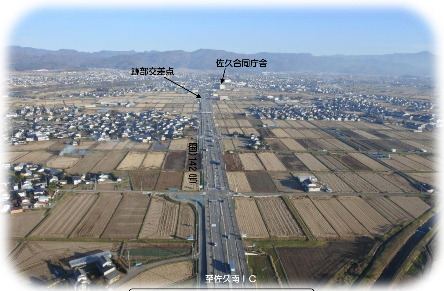
全景（佐久南 IC 側から跡部を臨む）