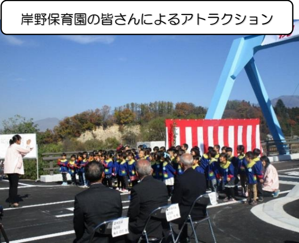
岸野保育園の皆さんによるアトラクション