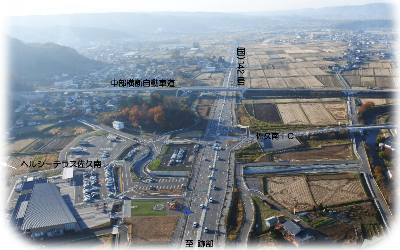
全景（佐久南ICから立科側を臨む）