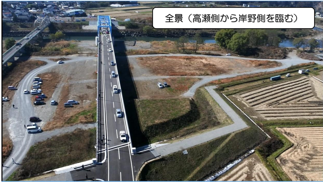
全景（高瀬側から岸野側を臨む）